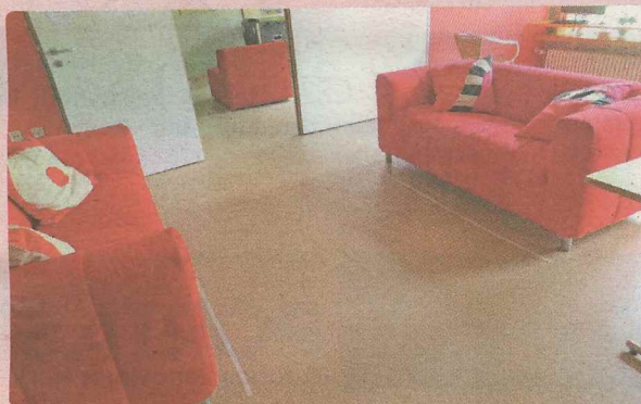
Abstandsregeln einhalten: Im Kinder- und Jugendtreff Schäwie können sich wieder kleine Gruppen für ein bis zwei Stunden treffen. Die Möbel sind schon dafür umgestellt.

und haben dann die Einrichtung für sich. Die Möbel sind schon dafür umgestellt, „wir können mit Abstand und dem Cliquenmodell starten“, freut sich Fassbender. Derzeit können Gruppen von bis zu fünf Personen die Räumlichkeiten nutzen. Eine Anmeldung hierzu ist unter der Tel. (089) 540454616, per WhatsApp unter der Nummer 0178 3021329 oder per Mail an kjt-schaeferwiese@kjr.de beim Kinder- und Jugendtreff nötig. Weitere Informationen unter www.schaeferwiese.de im Internet.